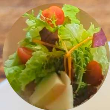
フレッシュ野菜のサラダ

1日のはじまりに、フレッシュな野菜のサラダとゆし豆腐やアーサのスープ。 自家製無農薬小麦「島麦かなさん」を使ったトーストにはちみつを添えて。